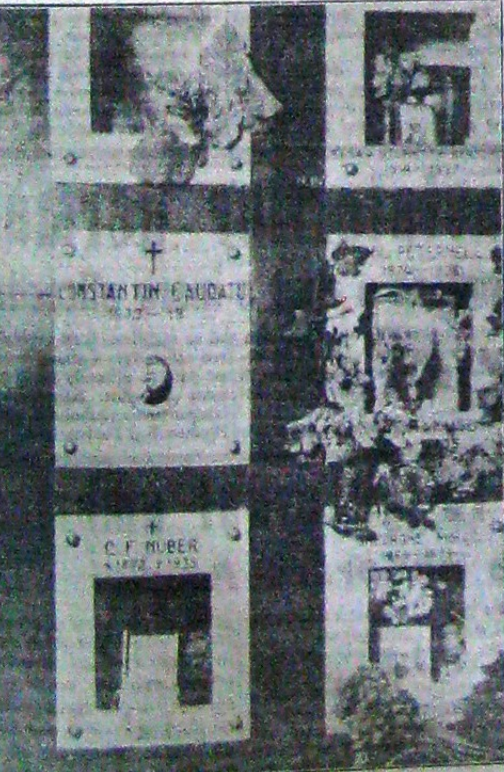
Chipuri nu fost și din cari nu a mai rămas decât cenușa...

Societatea română de urologie ține Adunarea generală Vineri, 17 Ianuarie 1941, orele 21, în amfiteatrul spitalului Coltea având următoarea ordine de zi: Cuvântul de deschidere al Președintelui; raportul secretarului general; raportul casierului; raportul cenzurilor și descărcarea de gestiune; alegerea noului comitet; alegerea comisiiei de cenzori.