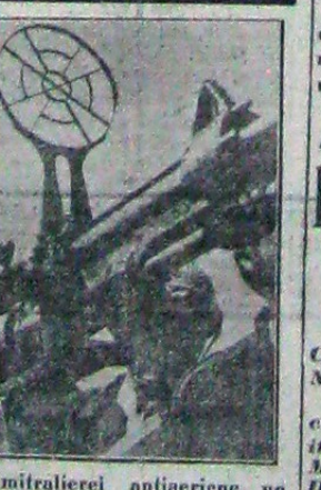
Soldatii italieni urmărind cu focal mitralierei antiaeriene, un avion inamic

ROMA, 15 (Rador). — Propaganda engleză stăruie de câteva zile asupra unor probleme dificile ale Italiei în domeniul explozibililor, afirmând că materiile prime necesare pentru fabricarea acestora, în special cele importante, s'ar fi terminat. În cercurile italiene complicități se subliniază că asemenea afirmații s'le propagă din invidia și absolut lipsite de temelii și că Italia a rezistat de multă vreme, grație autorității cu problema explozibililor, folosind materii prime produse în cea mai mare parte în țară și care dau rezultate foarte bune. Se subliniază de asemenea că, chiar dacă Italia ar avea nevoie de pildă de Armitolulobol, aliații sa Germania, care este nașcuna ei I produce în cea mai mare cantitate din Europa, și țara pune la dispoziție dacă din întâmplare Italia ar avea nevoie de el.